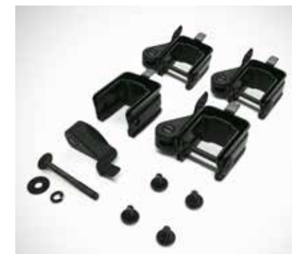
U-adapter Samo za nosilec za smuči tip 600 99701ADE00 in tip 400 99701ADE10 za kovinski strešni nosilec 99701ADE90