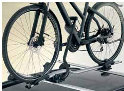
Nosilec za kolo Pro (samo v kombinaciji z adapterjem za kovinski strešni nosilec 99700ADE90) maksimalna obremenitev 20 kg 99700ADE00