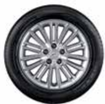
17 palčno aluminijasto platišče (pnevmatika ni vključena) 7.0Jx17, 215/55 R17 Okrasni pokrovček in 5 matic vključeni. J9F40AK200