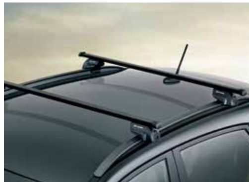
Strešni nosilec – kovinski maksimalna obremenitev 80 kg J9211ADE00ST (samo za vozila z OE vzdolžnimi nosilci)