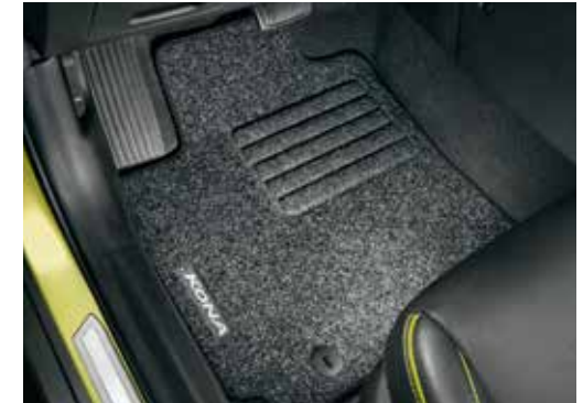
Tepihi iz blaga, standard komplet štirih (voznikov tepih z napisom Kona) J9141ADE00H

Zadaj (samo v kombinaciji s sprednjo): 99650ADE30 (modra) 99650ADE30W (bela)