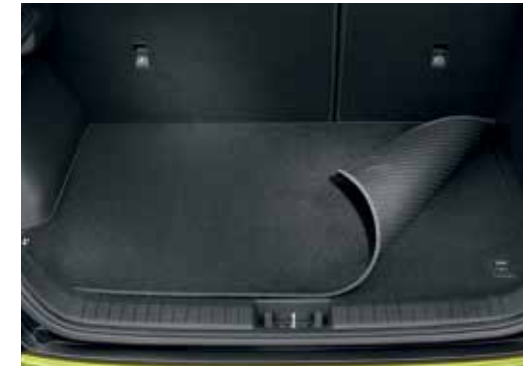
Tepih za prtljažni prostor / obojestranski J9120ADE10 (univerzalni, delno pokrit prtljažni prostor, logo Hyundai)