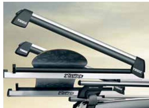
Nosilec za smuči in snežne deske Xtender 55700SBA10 (do 6 parov smuči ali 4 snežne deske)