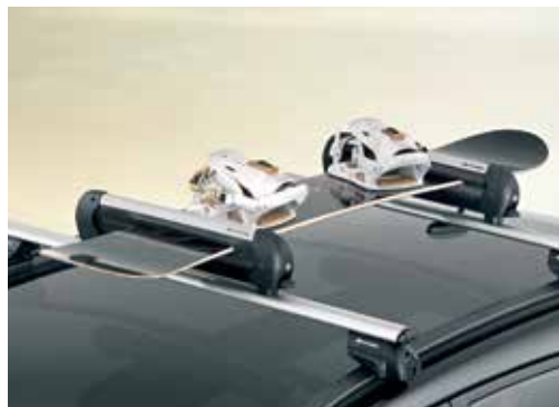
Nosilec za smuči in snežne deske tip 400 99701ADE10 (do 4 pare smuči ali 2 snežni deski) 99701ADE90 (U-adapter za montažo na kovinski nosilec)