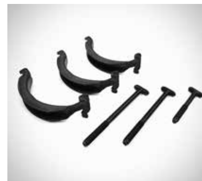
Adapter za kovinski strešni nosilec samo za nosilec za kolo Pro 99700ADE00 99700ADE90