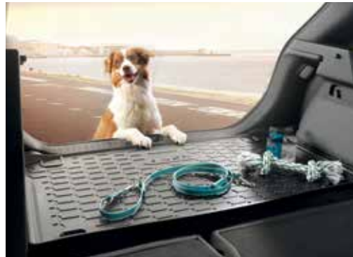
Zaščitno korito za prtljažni prostor J9122ADE00 (za vozila z nizkotonskim zvočnikom) J9122ADE20 (za vozila brez nizkotonskega zvočnika)