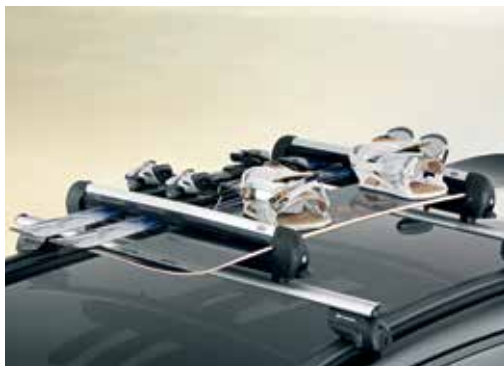
Nosilec za smuči in snežne deske tip 600 99701ADE00 (do 6 parov smuči ali 4 snežne deske) 99701ADE90 (U-adapter za montažo na kovinski nosilec)