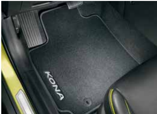
Tepihi iz blaga, velur komplet štirih (voznikov tepih z napisom Kona) J9143ADE00H