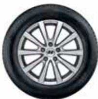
17 palčno aluminijasto platišče Halla (pnevmatika ni vključena) 7.0Jx17, 215/55 R17 Okrasni pokrovček vključen, matice niso vključene. A4400ADE01