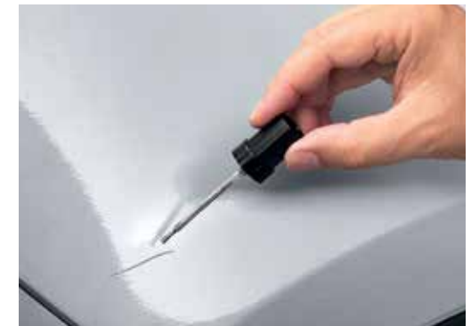
Korekturna barva* LPA10APEXXXXH *pri svojem prodajalcu preverite kataloško številko in razpoložljivost