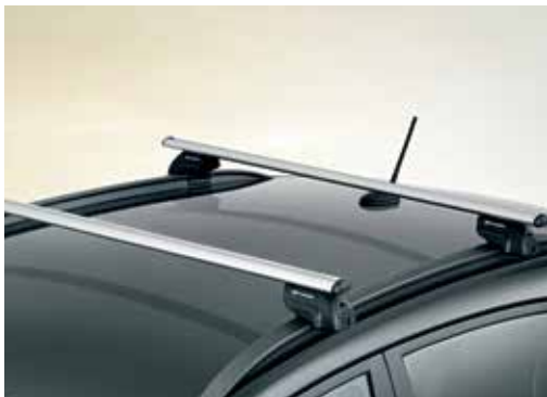
Strešni nosilec – ALU maksimalna obremenitev 80 kg J9211ADE00AL (samo za vozila z OE vzdolžnimi nosilci)