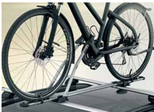
Nosilec za kolo Active (adapter za kovinski strešni nosilec vključen) maksimalna obremenitev 17 kg 99700ADE10

Več informacij pri pooblaščenem prodajalcu vozil Hyundai.