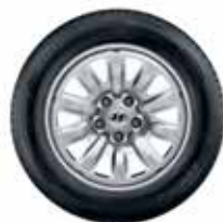
17 jekleno platišče (pnevmatika ni vključena) 7.0Jx17, 215/55 R17 Okrasni pokrovček vključen, matice niso vključene. D7401ADE00