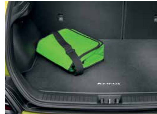
Tepih za prtljažni prostor z napisom Kona / enostranski - velur J9120ADE00 (za vozila brez nizkotonskega zvočnika)