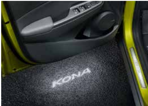
LED pomožna lučka s projekcijo logotipa KONA (za prednja vrata) J9651ADE00