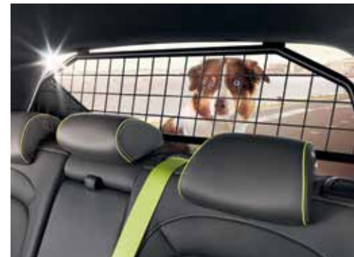
Predelna mreža / zgornji okvir J9150ADE00