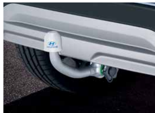
Vlečna kljuka – vertikalno snemljiva J9281ADE00