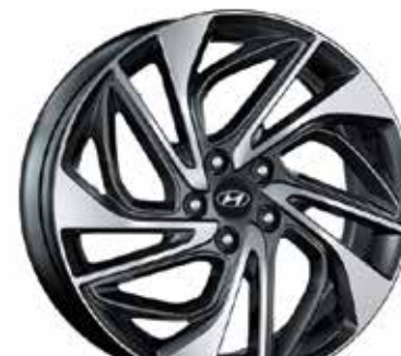
19 palčna aluminijasta platišča 7.5Jx19, 245/45 R19 (za TPMS ventil*) 52910D7470PAC (TPMS ventil ni vključen) 52933C1100 (TPMS ventili)

*TPMS – sistem nadzora tlaka v pnevmatikah