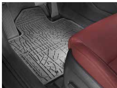
Tepihi iz gume komplet štirih D7131ADE50