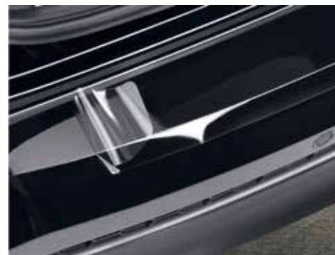
Zaščita odbijača / transparentna folija D7272ADE01TR