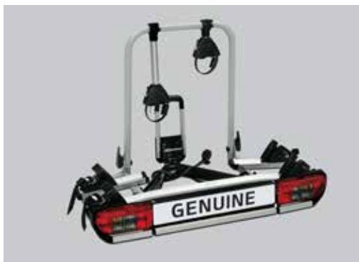
Nosilec za 2 kolesi / pritrditev na vlečno napravo nosilnost 60 kg E823055001