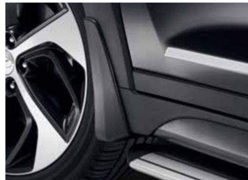
Zaščitne zavesice D3F46AK000 (sprednje / komplet dveh) D3F46AK150 (zadnje / komplet dveh)