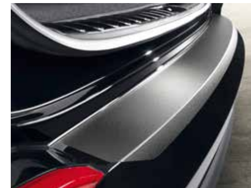
Zaščita odbijača / črna folija D7272ADE01BL