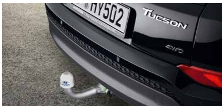
Vlečna kljuka / vertikalno snemljiva / ko ni v uporabi, ni vidna D7281ADE10