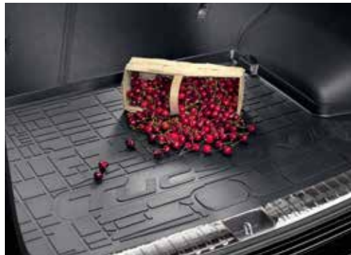
Zaščitno korito prtljažnika D7122ADE00