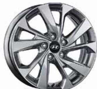
17 palčna aluminijasta platišča 7.0Jx17, 225/60 R17 (za TPMS ventil*) 52910D7220PAC (TPMS ventil ni vključen) 52933C1100 (TPMS ventili)