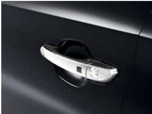
Zaščitna folija pod kljuko / komplet štirih 99272ADE00