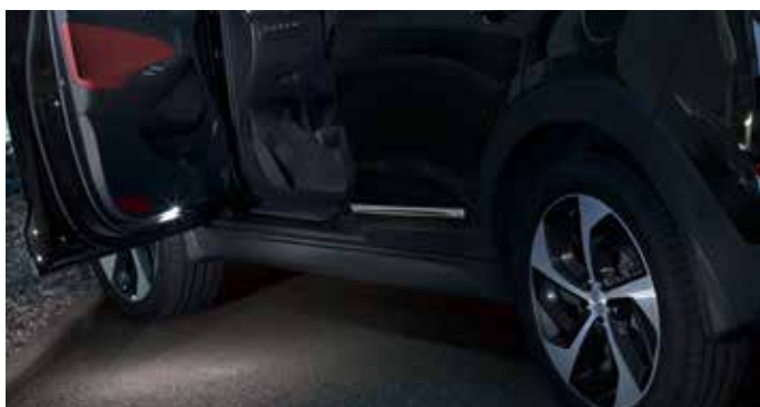
LED osvetlitev vstopa / za prednja vrata 99651ADE00