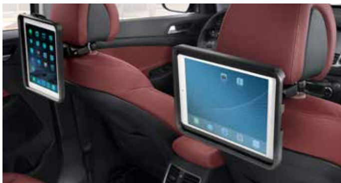
Nosilec za iPad 1, 2, 3, 4 in iPad Air 1 in 2 99582ADE01