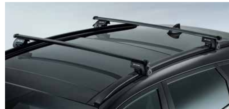
Strešni nosilci / KOVINSKI D7211ADE50ST