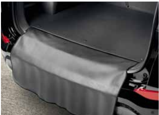
Zaščitna prevleka za odbijač 55120ADE00 (samo v kombinaciji s tepihom D7120ADE00)