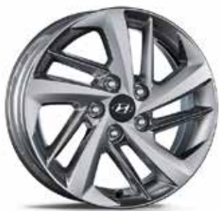
16 palčna aluminijasta platišča 6.5Jx16, 215/70 R16 (za TPMS ventil*) 52910D7120PAC (TPMS ventil ni vključen) 52933C1100 (TPMS ventili)