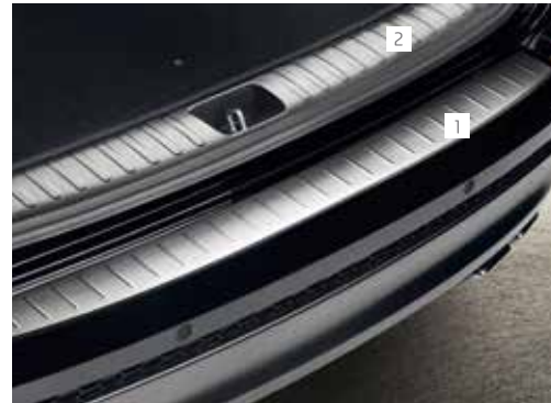
1. Zaščita odbijača / brušeno jeklo D7274ADE21ST 2. Zaščita nakladalnega roba / brušeno jeklo D7274ADE30ST