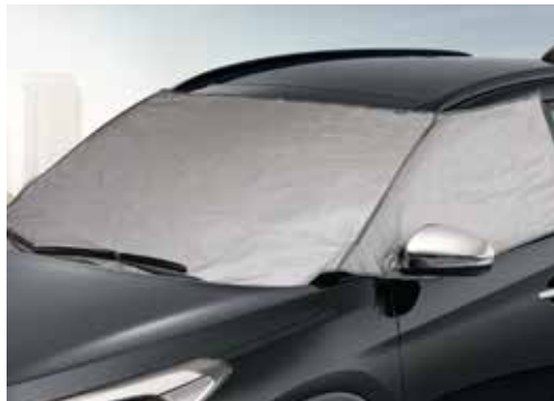
Zaščita pred soncem in snegom D7723ADE00