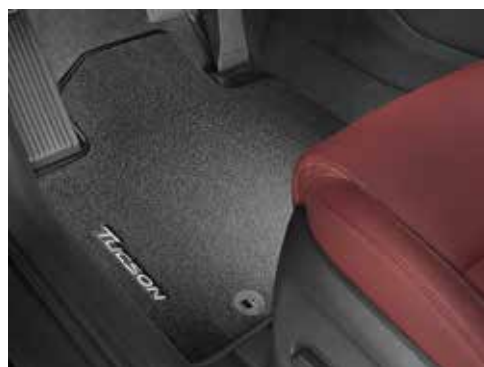
Tepihi iz blaga / velur komplet štirih D7143ADE50