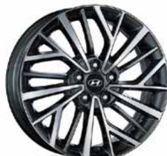
18 palčna aluminijasta platišča 7.0Jx18, 225/55 R18 (za TPMS ventil*) 52910D7370PAC (TPMS ventil ni vključen) 52933C1100 (TPMS ventili)

*TPMS – sistem nadzora tlaka v pnevmatikah