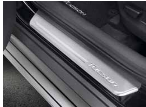
Zaščitna leteva na vstopnem pragu vrat / nerjaveče jeklo komplet štirih D7450ADE00ST