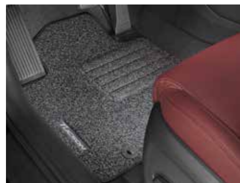
Tepihi iz blaga / standard komplet štirih D7141ADE50