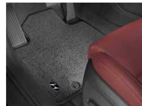
Tepihi iz blaga Premium / velur D7144ADE50