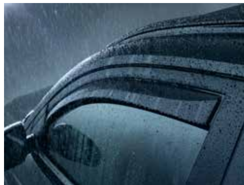
Usmerjevalnik zraka za prednja vrata / komplet dveh D7221ADE00