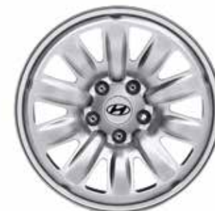
17 palčna jeklena platišča / srebrne barve 7.0Jx17, 225/60 R17 (za TPMS ventil*) D7401ADE00PAC (TPMS ventil ni vključen) 52933C1100 (TPMS ventili)