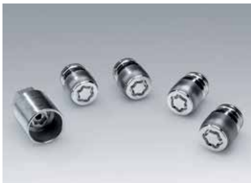
Komplet štirih varnostnih matic in ključ / zaščita pred krajo platišč 99490ADE50