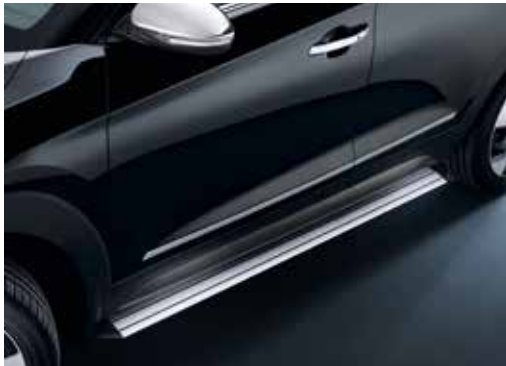
Stranska stopnica / alu D7370ADE00