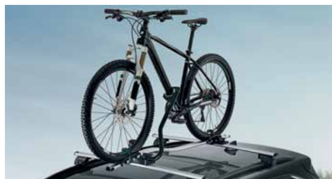
Nosilec za kolo ProRide nosilnost 20 kg 55701SBA10