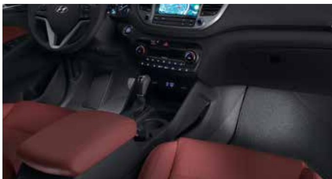
LED osvetlitev / spredaj 99650ADE020W (bela) 99650ADE020 (modra)