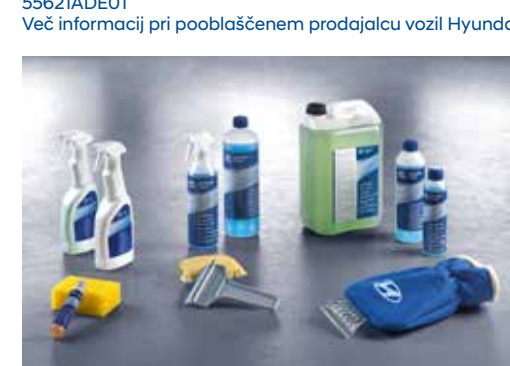
Pripomočki za čiščenje in vzdrževanje*

* Pri svojem prodajalcu preverite kataloško številko in razpoložljivost.