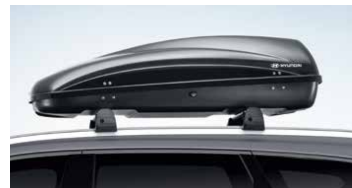
Strešni kovček nosilnost 75 kg 99730ADE10 (330/Dimenzije: 144x86x37,5cm/330L) 99730ADE00 (390/Dimenzije: 195x73,8x36cm/390L)