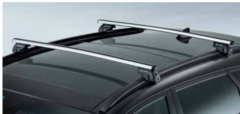
Strešni nosilci / ALU D7211ADE51AL