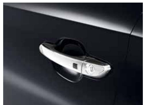
Zaščitna folija pod kljuko / komplet štirih 99272ADE00