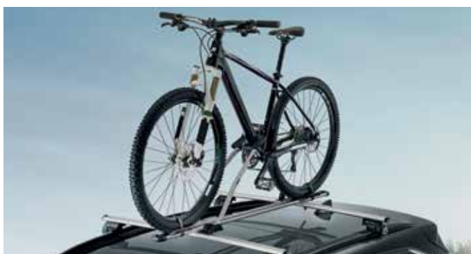
Nosilec za kolo FreeRide nosilnost 17 kg 55701SBA21 (vključuje T-vijake za pritrditev)