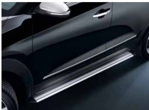
Stranska stopnica / alu D7370ADE00