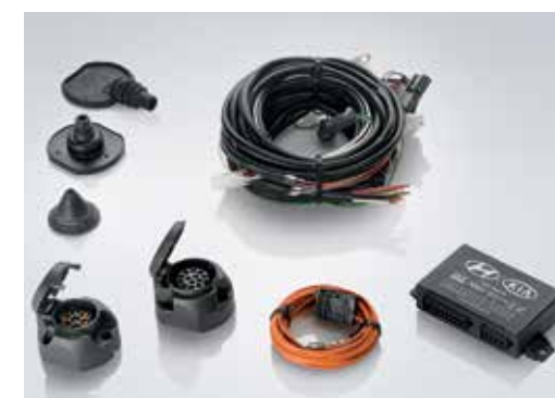
Ožičenje za vlečno kljuko / priklop na originalni konektor a) s 7 polno vtičnico in zaščitnim modulom D7620ADE50CP b) s 13 polno vtičnico in zaščitnim modulom D7621ADE50CP c) +15/+30 razširitveni komplet 55621ADE01 Več informacij pri pooblaščenem prodajalcu vozil Hyundai.