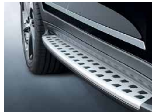
Stranska stopnica / mat alu (ni združljivo s sprednjimi zavesicami) D3875AB000