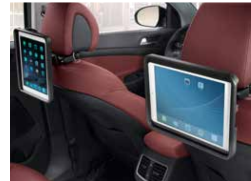
Nosilec za iPad 1, 2, 3, 4 in iPad Air 1 in 2 99582ADE01