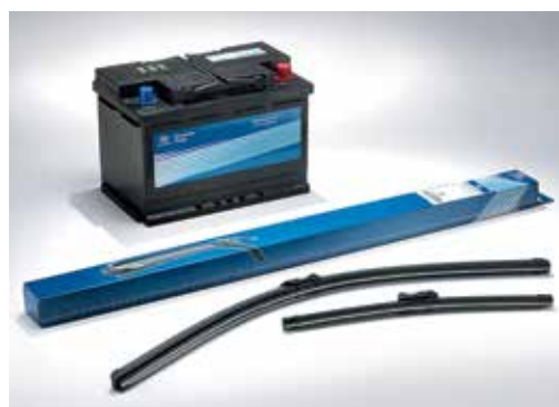
Akumulator in metlice brisalcev*

* Pri svojem prodajalcu preverite kataloško številko in razpoložljivost.