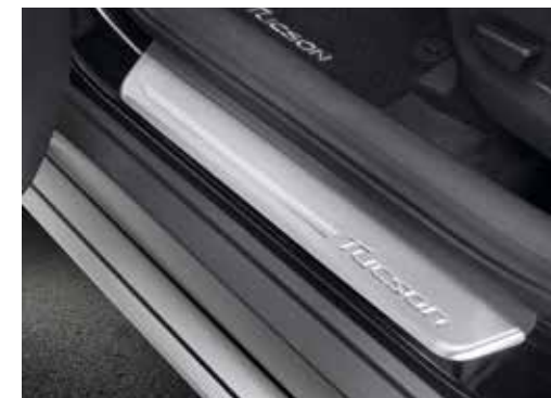
Zaščitna letev na vstopnem pragu vrat / nerjaveče jeklo komplet štirih D7450ADE00ST