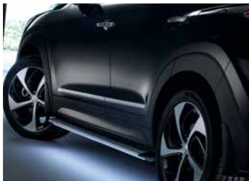
Bočne letve / svetleče, nerjaveče jeklo D7271ADE00ST Bočne letve / brušeno jeklo D7271ADE10ST