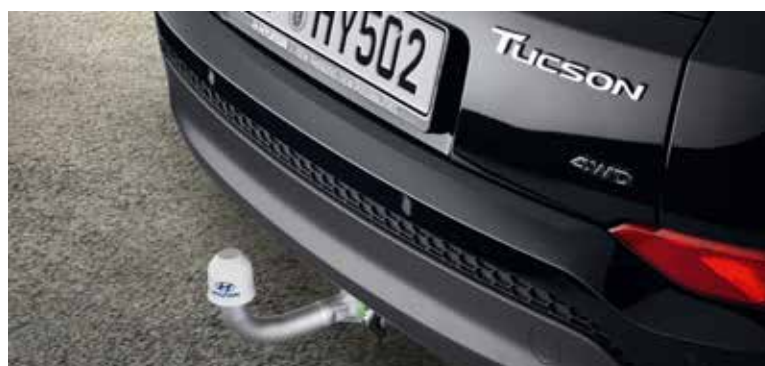
Vlečna kljuka / vertikalno snemljiva / ko ni v uporabi, ni vidna D7281ADE10