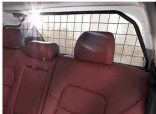
Predelna mreža / zgornji okvir D7150ADE00