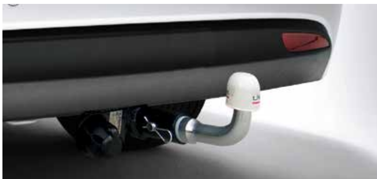
Vlečna kljuka / domači proizvajalec / snemljiva / vtičnica vidna Več informacij pri pooblaščenem prodajalcu vozil Hyundai.