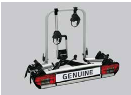
Nosilec za 2 kolesi / pritrditve na vlečno napravo nosilnost 60 kg E823055001