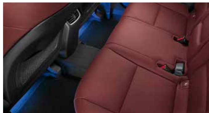
LED osvetlitev / zadaj 99650ADE30W (bela) 99650ADE30 (modra)