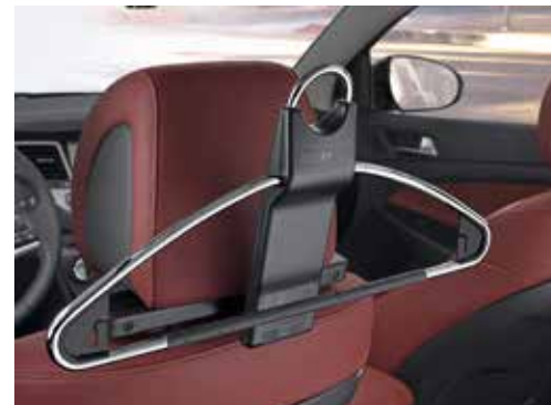
Obešalnik / snemljiv 99770ADE10