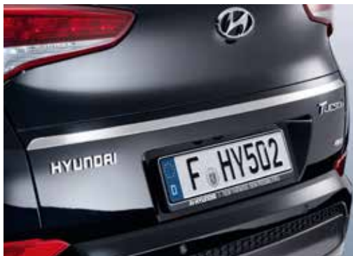
Okrasna letev pokrova prtljažnika / svetleče, nerjaveče jeklo D7491ADE01ST Okrasna letev pokrova prtljažnika / brušeno jeklo D7491ADE11ST