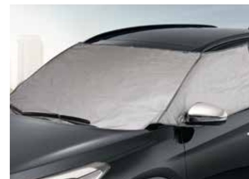
Zaščita pred soncem in snegom D7723ADE00