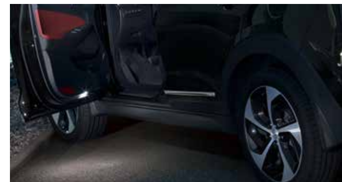
LED osvetlitev vstopa / za prednja vrata 99651ADE00