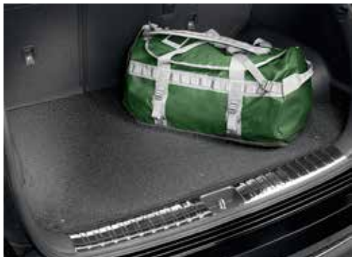
Tepih za prtljažni prostor / dvostranski D7120ADE01