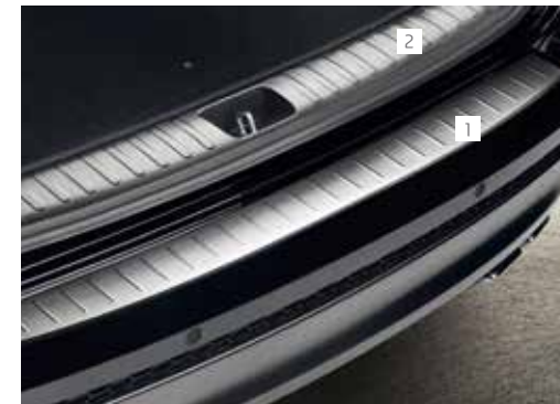
1. Zaščita odbijača / brušeno jeklo D7274ADE21ST 2. Zaščita nakladalnega roba / brušeno jeklo D7274ADE30ST