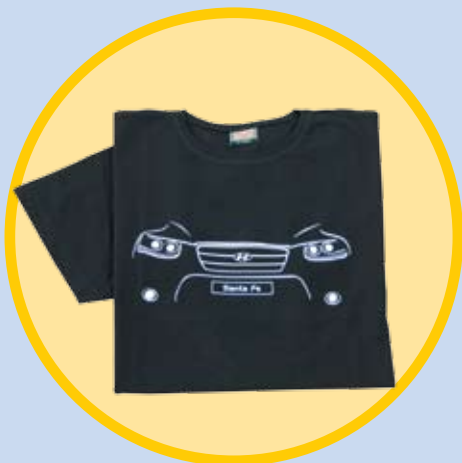
Majica Santa Fe kratek rokav - črna (moška/ženska)