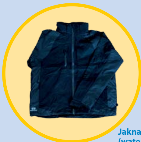
Jakna Hyundai - črna (waterproof moška/ženska)