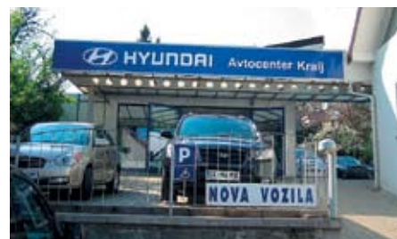
CAST d.o.o. - AVTO CENTER KRALJ, Polzela 91a, 3313 Polzela 03 / 705 04 00