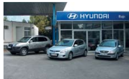
BAJC d.o.o., PE NOVA GORICA, Industrijska c. 5, Kromberk, 5000 Nova Gorica 05 / 330 45 22