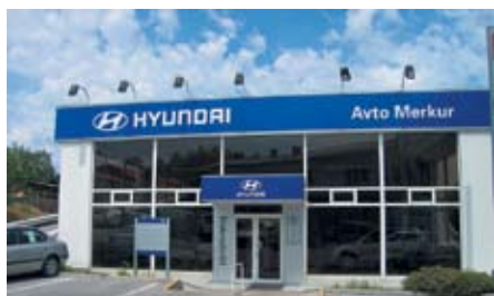
AVTOMERKUR d.d., Samova 14, 1000 Ljubljana 01 / 306 60 20