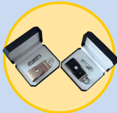
USB ključ Hyundai