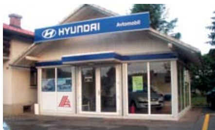
AVTOMOBIL d.o.o. PE ČRNOMELJ, Belokranjska 14, 8340 Črnomelj 07 / 305 64 99