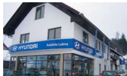
AVTOMEHANIKA LUŠINA FRANC s.p., Gosteče 8, 4220 Škofja Loka 04 / 502 20 00