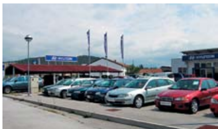
NOVA OLIMPIJA d.o.o., PE SEŽANA, Partizanska cesta 75d, 6210 Sežana 05 / 731 04 00