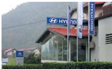
AVTOHIŠA RUTAR d.o.o., Slap ob Idrijci 38, 5283 Slap ob Idrijci 05 / 380 90 70, 380 92 11