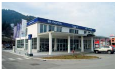
CAST d.o.o. - AVTO CENTER KRALJ, Ind. cona Pameče, 2380 Slovenj Gradec 02 / 882 16 62