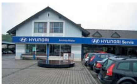
AVTOHIŠA MLAKAR d.o.o., Stopče 32b, 3231 Grobelno 03 / 746 61 00, 746 61 02