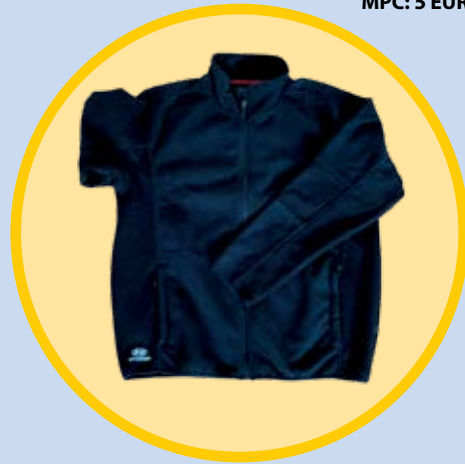
Flis windstopper Hyundai - črn (moški/ženski)