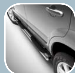
Stranska stopnica MPC 886,14 EUR