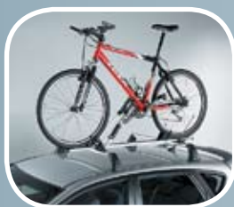
Nosilec kolesa - alu (5v - 118,20 EUR)