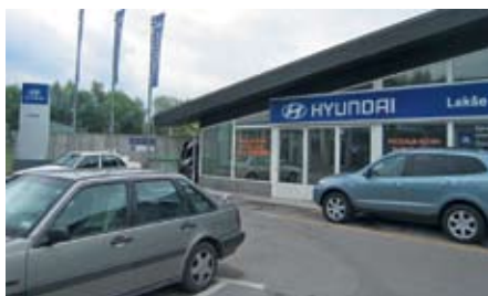
AVTOCENTER LEKŠE d.o.o., Ul. Lovre Klemenčiča 1, 1000 Ljubljana 01 / 420 10 05