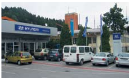
INTERSERVICE d.o.o. - PETRBOVLJE, Savinjska cesta 36, 1420 Trbovlje 03 / 562 54 52