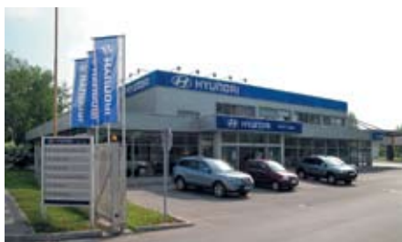
HYUNDAI AVTO TRADE d.o.o. Ljubljana, Brnčičeva 45, 1231 Ljubljana-Črnuče 01 / 530 77 56