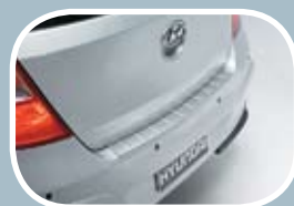
Zaščitna letvica zadnjega odbijača - alu dizajn (5v - 65,14 EUR; cw - 84,06 EUR)