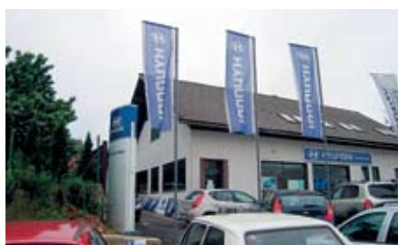
AVTOHIŠA ADRIA, ADRIA PLUS d.o.o., PE TREBNJE, Glavarjeva 10, 8210 Trebnje 07 / 348 17 00