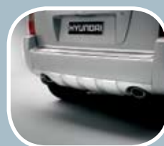
Zaščita zadnjega odbijača v imitaciji aluminija MPC 444,16 EUR