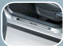
Okrasne letvice pragov (5v - 145,25 EUR; cw - 145,25 EUR)