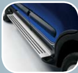
Stranska stopnica MPC 656,51 EUR