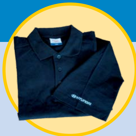
Polo majica Hyundai kratek rokav - črna (moška)