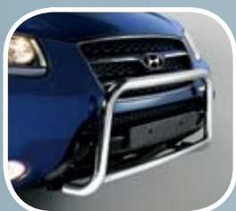
Zaščita prednjega odbijača MPC 600,08 EUR