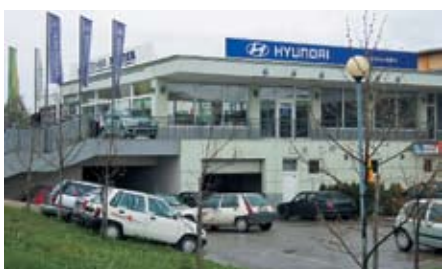
AVTOHIŠA ADRIA, ADRIA PLUS d.o.o., PE KRŠKO, Cesta krških žrtev 137, 8270 Krško 07 / 490 57 90